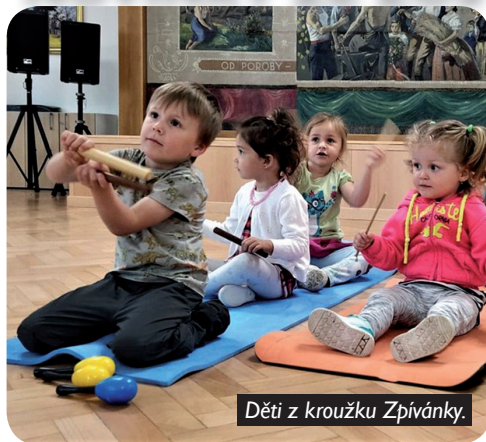
Děti z kroužku Zpívánky.

Po koronavirové odmlce se opět rozezněla hudba a dětský zpěv a smích na dopoledním kroužku pro děti a jejich rodiče a obě dopolední pondělní skupiny od poloviny května tančily, zpívaly a hrály na hudební nástroje v malém sále KD v Kyšicích. O prázdninách mohou rodiče malých dětí využít jednorázové lekce, o kterých se dočtete na jiném místě tohoto zpravodaje. Od září připravujeme opět pravidelné pondělní zpívánky, pro menší děti dopoledne a pokračovací odpolední hodinu pro děti, které již půjdou do mateřské školy. O bližší info a přihlášku pište na jary.smolakova@gmail.com .