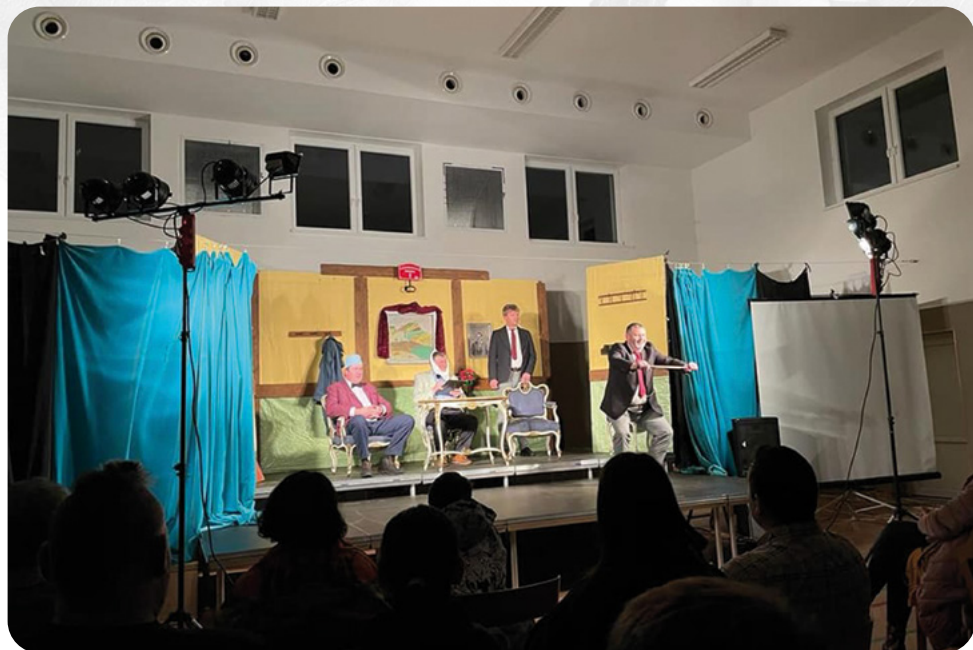
TRUS - Divadelní představení „Vražda v salónním kupé“