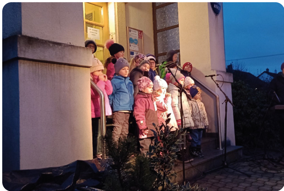
Zpívání dětí z mateřské školy Kyšice