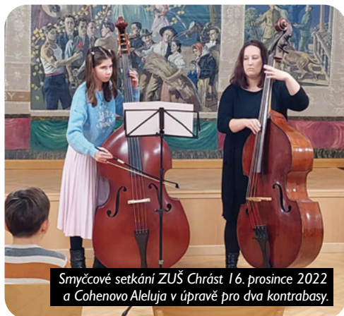
Smyčcové setkání ZUŠ Chrást 16. prosince 2022 a Cohenovo Aleluja v úpravě pro dva kontrabasy.