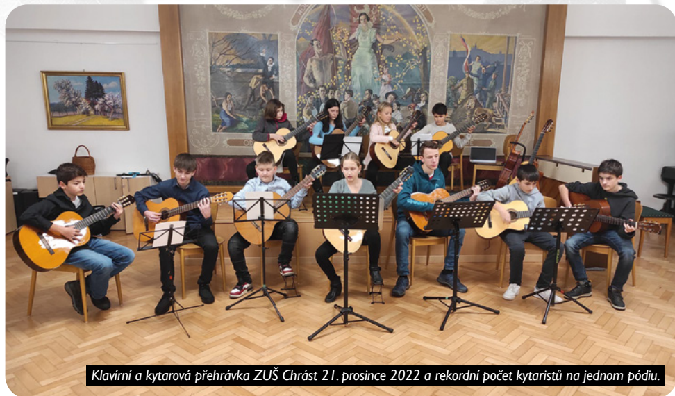
Klaviřní a kytarová přehrávka ZUŠ Chrást 21. prosince 2022 a rekordní počet kytaristů na jednom pódiu.

V letošním roce slaví ZUŠ Chrást 50 let svojí samostatné existence. Kromě řady menších akcí k tomuto výročí se připravujeme především na Slavnostní koncert žáků, na který vás srdečně zveme do Lidového domu v Chrástu v pátek 28. dubna.