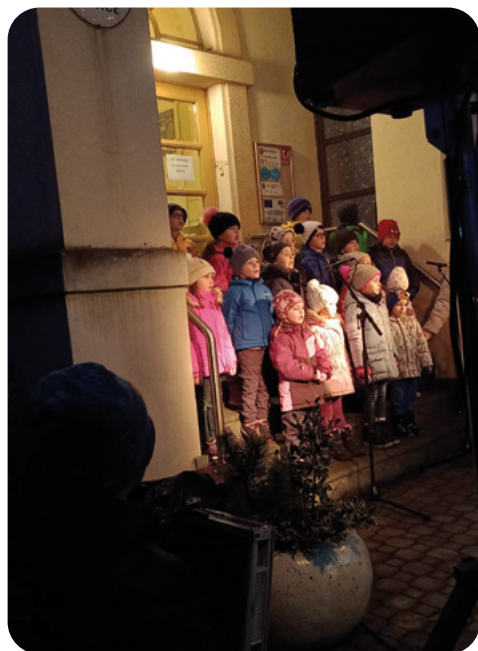
Zpívání dětí z mateřské školy Kyšice