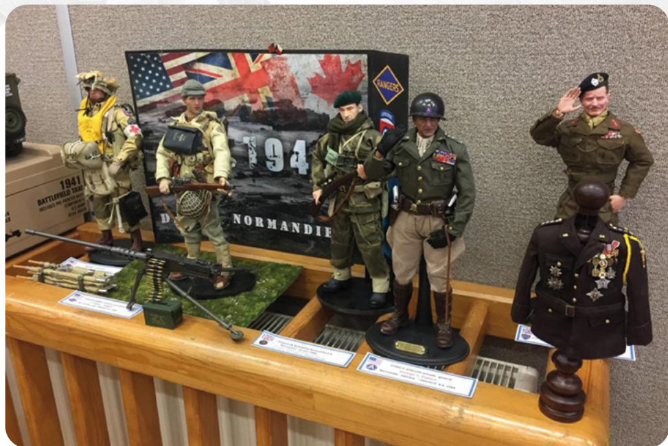
Modeláři XIX. ročník veřejné soutěže a výstavy plastických modelů letadel a bojové techniky CONVENTION 2022