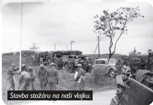
Stavba stožáru na naši vlajku.