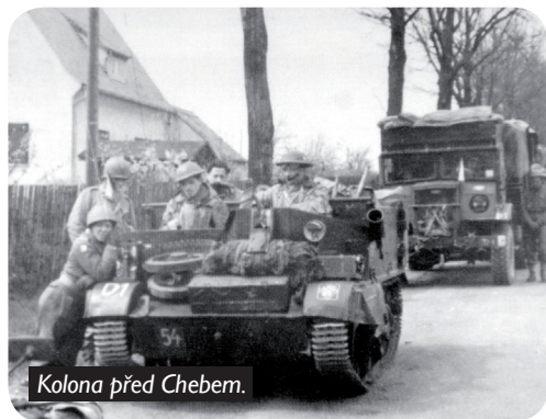
Kolona před Chebem.