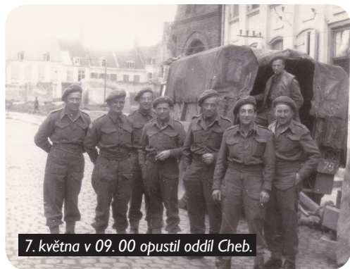
7. května v 09. 00 opustil oddíl Cheb.